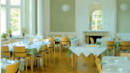
Speisesaal im Schloss

der zukünftigen Teilnahme in einer Selbsthilfegruppe oder der weiteren Betreuung oder Behandlung in einer Fachambulanz bzw. Beratungs- und Behandlungsstelle sollte ausführlich mit uns besprochen werden. Die reguläre Entlassung erfolgt nach Ablauf der vereinbarten Behandlungszeit.